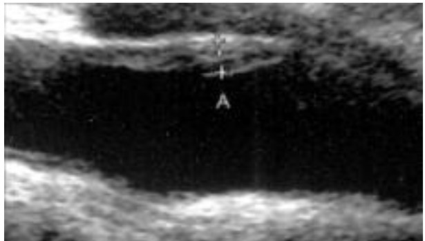
図 4-5 ブランク判定例